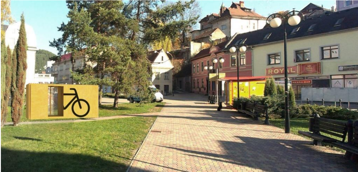
Fotomontáž. Zdroj: Verejná požičovňa bicyklov 2015: Montáž cykloboxu - participatívna komunita Ružomberok. 3.januára 2016. 57

V projekte boli zakúpené aj prvé tri mestské bicykle v „retro“ štýle, ktoré krátky čas používali aj občianski aktivisti, čo vzhľadom k predmetu projektu o cyklodoprave v meste nemohlo byť v rozpore s dobrými mravmi aktivistov a PAROZ-om.